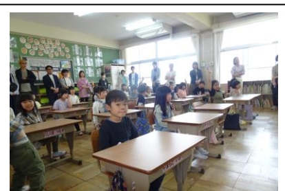
初めての参観日 1年生の様子

新しい学級担任と子どもたちの初めての参観授業は、いかがだったでしょうか。子どもたちも少し緊張しながらも、張り切っていたように思います。また、保護者の方に参観していただくということは、私たち教職員にとっても大きな励みになります。ありがとうございました。